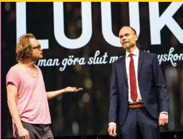
FÅR MAN GÖRA SLUT MED SITT SYSKON?