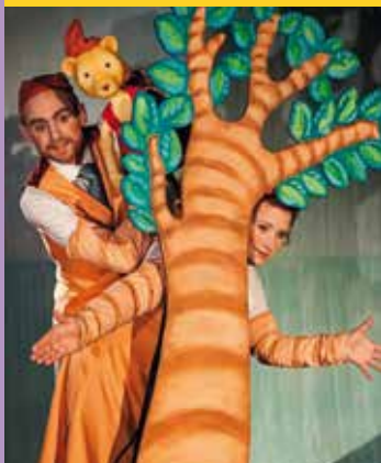
29 MARS NASSE – MUSIKALEN!