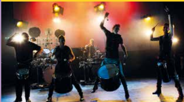
13 FEBRUARI • KOMODO, KABARÉ KALABALIK