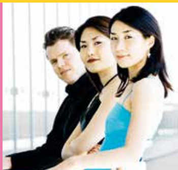
TRIO CON BRIO COOPENHAGEN