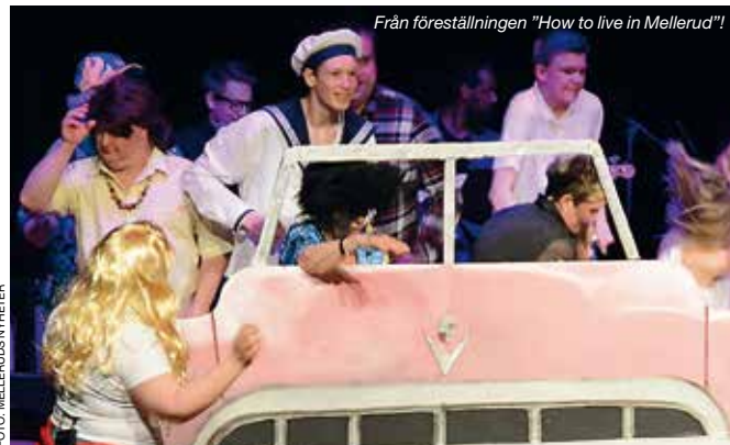
Från föreställningen "How to live in Mellerud!"

Intresserad? Läs gärna mer på vår hemsida www.kulturbuketpadal.se . Vill du vara med kontaktar du oss i Kulturbuket på Dal.